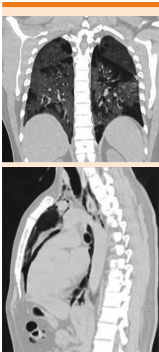
Figura 1. Hallazgos tomográficos compatibles con neumonía multisegmentaria (hallazgos clásicos-probables de COVID-19) mayor al 75%, según la British Society of Thoracic Imaging (BSTI) , y neumomediastino.

neumonía multisegmentaria ( Figura 1 ). El PCR-RT cualitativo SARS-CoV-2 fue positivo, tomado de una muestra de exudado nasofaríngeo.