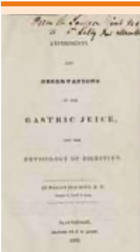
Figura 2. Portada del libro de W Beaumont.