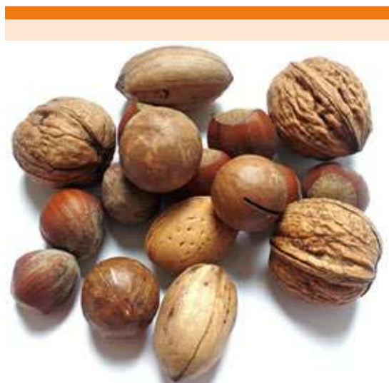
Figura 3. Nuez de Brasil.

forma aguda puede desencadenar: disnea, infarto de miocardio, insuficiencia renal y síntomas vasculares como enrojecimiento facial. 2 En la intoxicación aguda, que suele ser secundaria a una ingesta de dosis única, minutos u horas después pueden sobrevenir síntomas abdominales: náuseas, vómito, dolor, diarrea, aliento a ajo, así como síntomas y signos cardiacos: taquicardia e hipotensión.