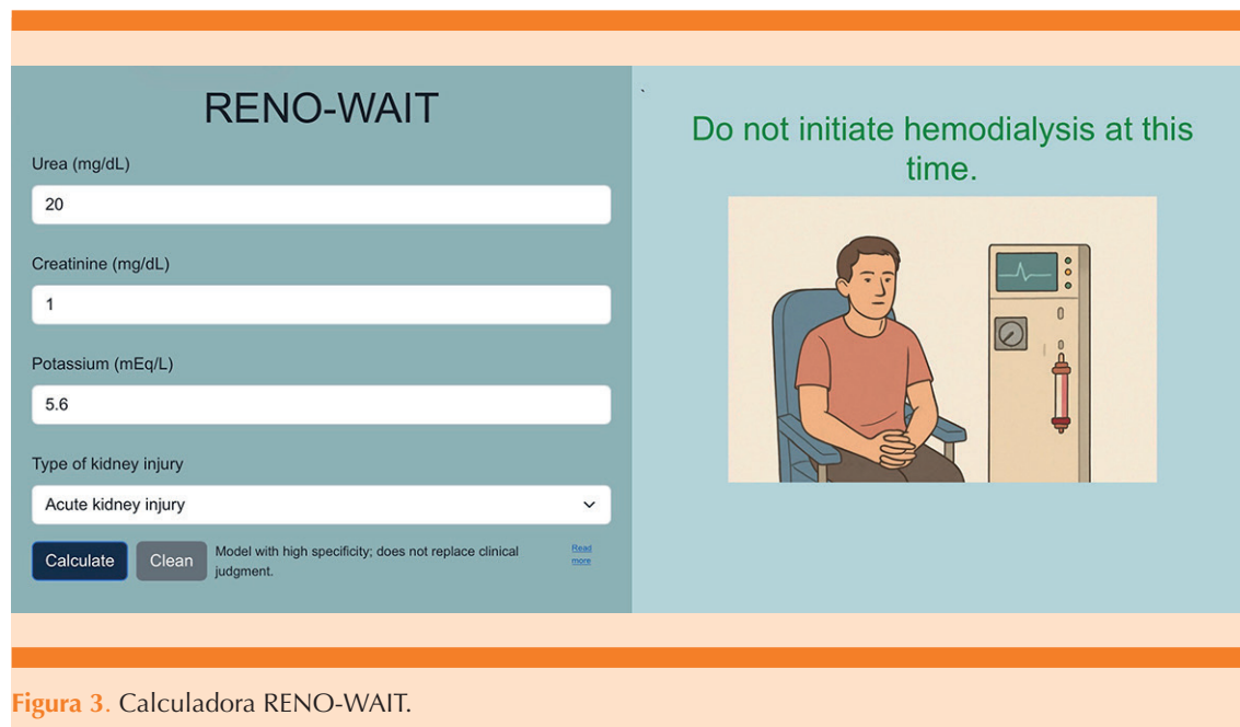
Figura 3. Calculadora RENO-WAIT.