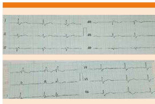
Figura 2. Electrocardiograma posterior al tratamiento.

el primer paso del abordaje. Partiendo de ello, y en caso de depresión ventilatoria, deben iniciarse ventilaciones mediante bolsa y mascarilla manteniendo adecuada oxigenación e incluso considerar la intubación endotraqueal; a menos